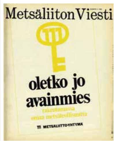
Metsäliiton pitkään käytössä olleen kirvesliikemerkin takana on hauska tarina. Merkki on lähtöisin Kirkniemen paperitehtaan osakeannin markkinoinnista.

jästä puolestaan totesi, ettei ”yhteisiä yrityksiä pidä arvostella vain niiden tämän hetken ja välittömän hyödyn perusteella. On nähtävä ne tärkeinä osatekijöinä siinä suuressa kokonaisuudessa, jolla maaseudun ja