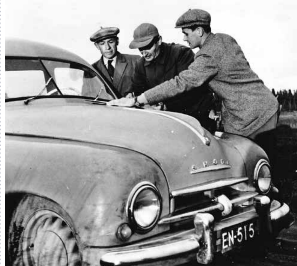
Metsäliiton Selluloosa Oy järjesti Äänekosken tehtaiden kaupan rahoittamiseksi osakemerkinnän. Myös metsänomistajat lähtivät innokkaasti mukaan yhtiön omistajiksi.

Paperitehdas valmisti pääasiassa sanomalehtipaperia ja puupitoista painopaperia. Kartonkitehtaan tuotteisiin kuului muun muassa kattuhuopa sekä oksa- ja pinkopahvi. Tehtaiden johtajana jatkoi pari vuotta aiemmin työssä aloittanut